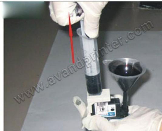
سرنگ را در جایگاه خود قرار داده و بعد اهرم آنرا بکشید تا جوهر را به درون آن بکشید.