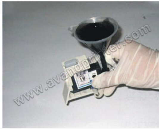
جوهر هم رنگ با هد را به مقدار ۲۰ میلی لیتر داخل قیف بریزید