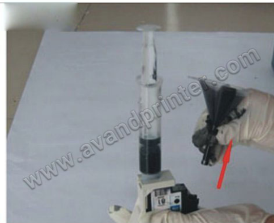
وقتی جوهر داخل قیف خالی شد، ۳۰ ثانیه صبر کرده و آنرا بردارید